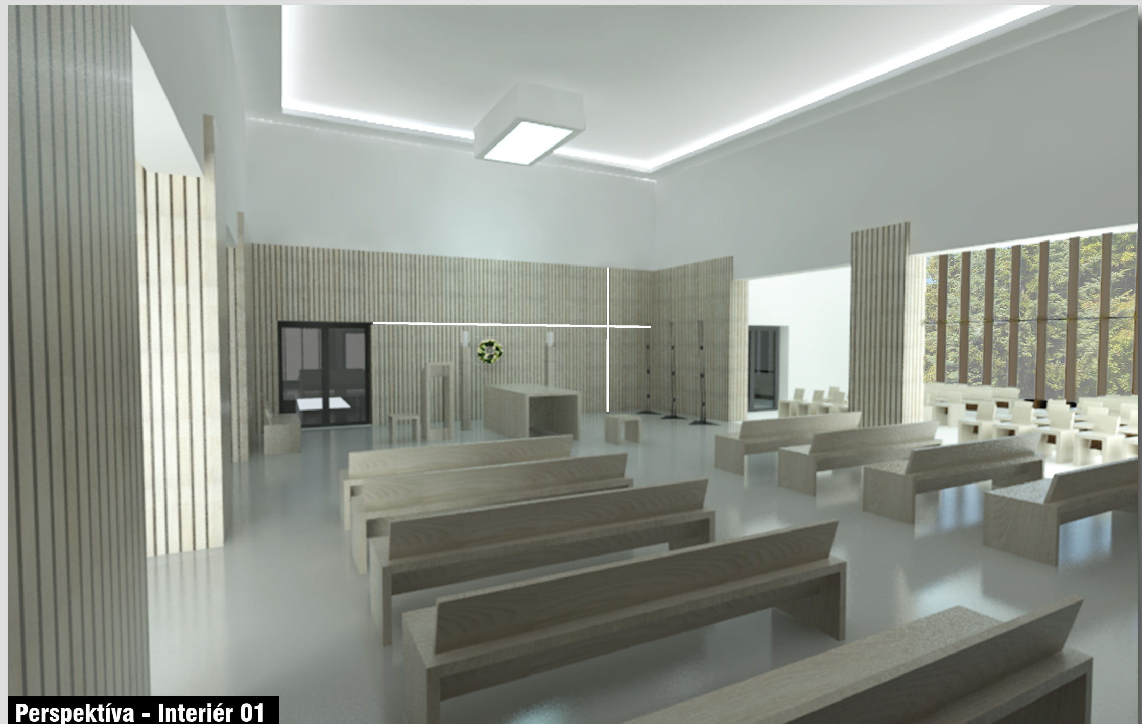
Perspektíva - Interiér 01