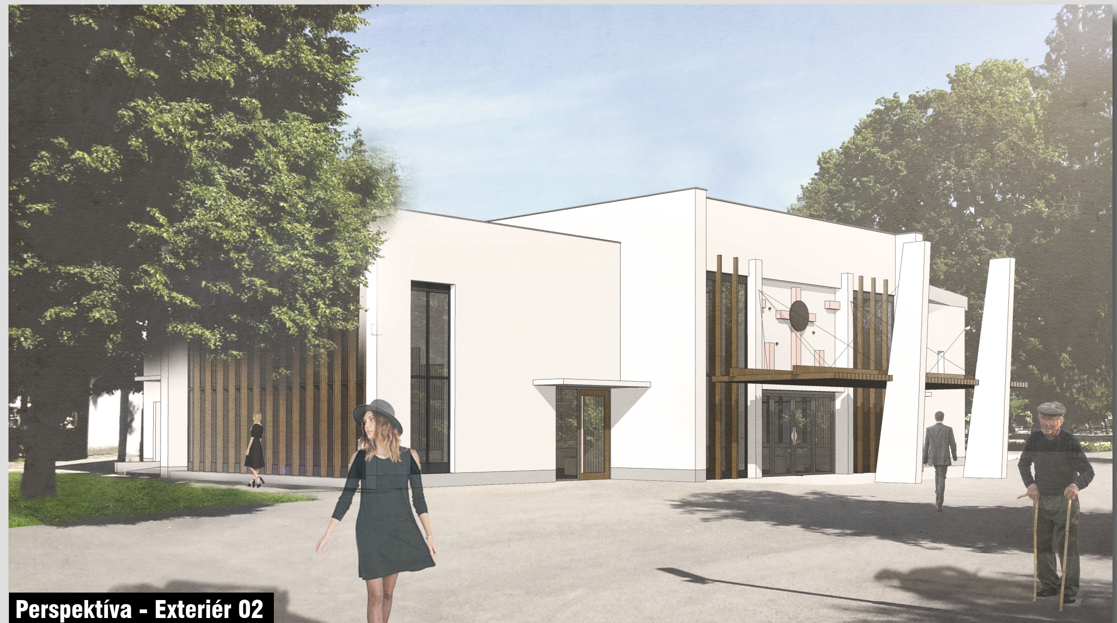
Perspektíva - Exteriér 02