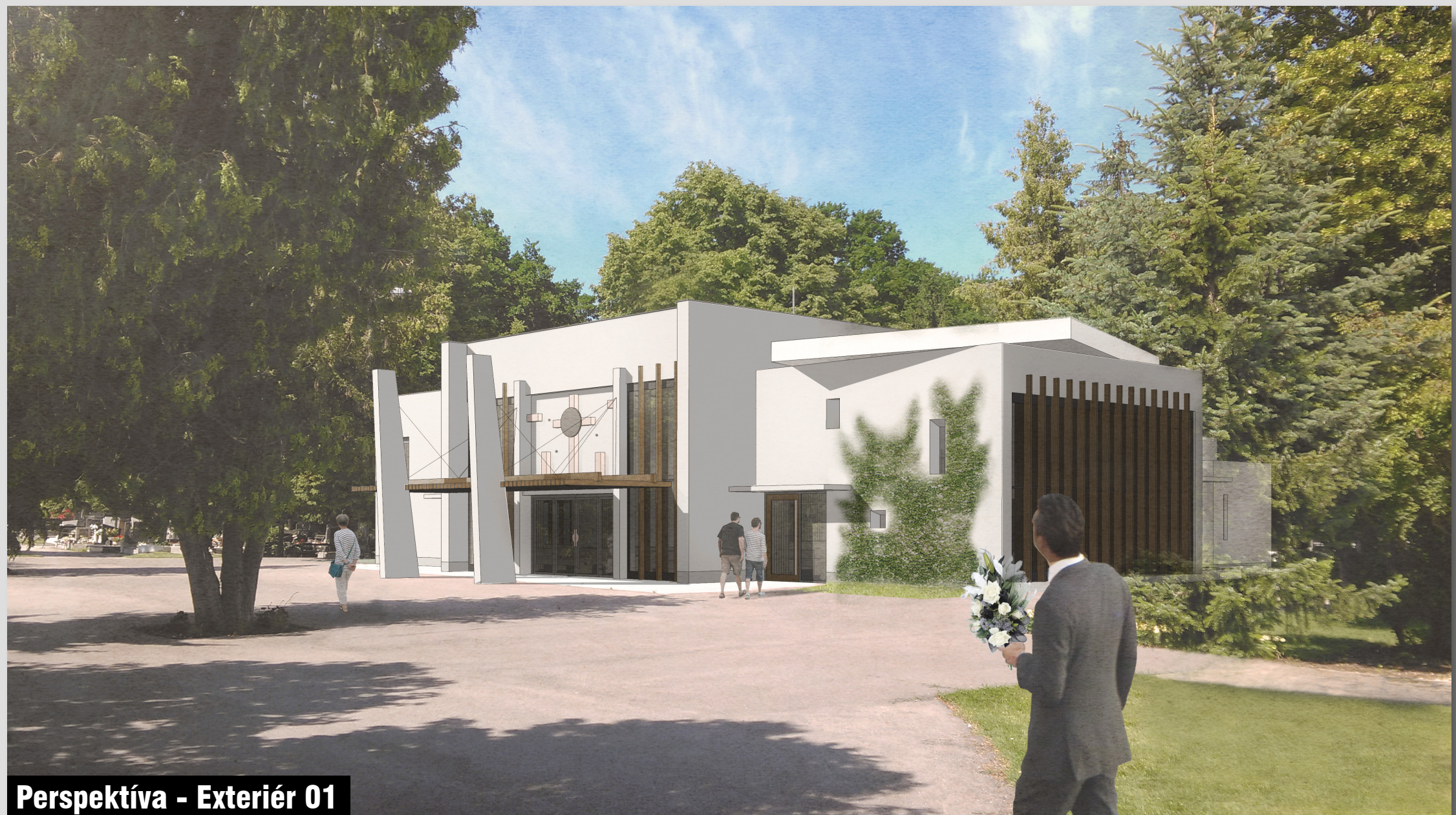
Perspektíva - Exteriér 01