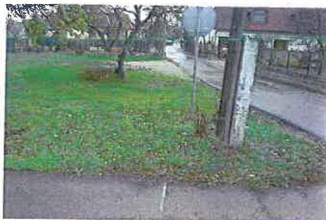
Pohľad z juhozápadu na predmetné parcely od ulice Kúpeľná