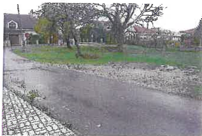
Pohľad zo severovýchodu na predmetné parcely od ulice Podzáhradná