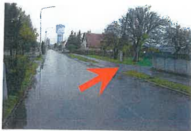
Ulica Kúpeľná s napojením ulice Podzáhradná