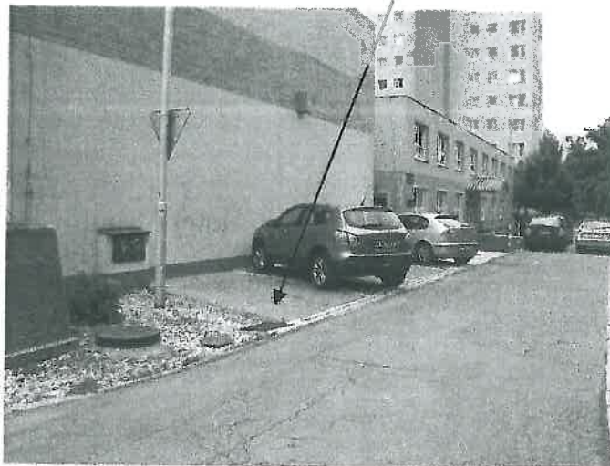
Pohľad na hodnotený pozemok na novovytvorenej parc. č. 1936/66 v Dunajskej Strede