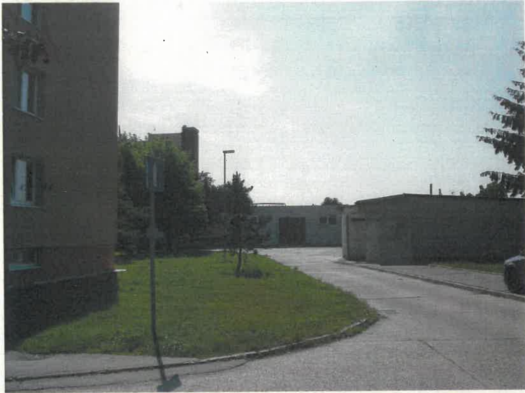
Pozemok parc. č.1786/39 v Dunajskej Strede