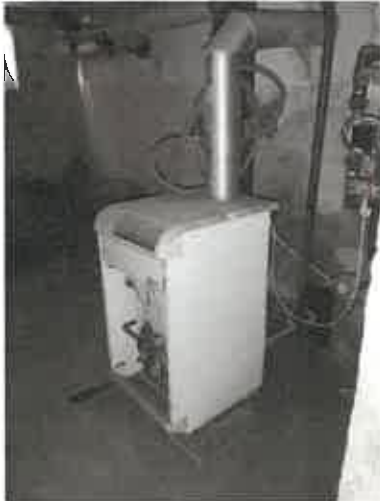
kotol v suteréne