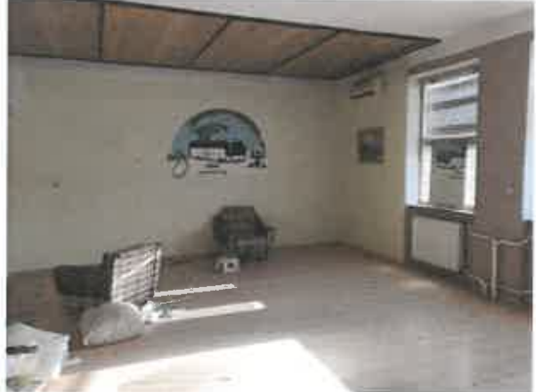
kancelárie na II. nadzemom podlaží