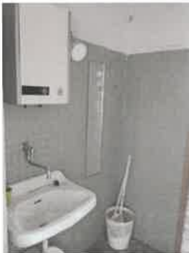
hygienická miestnosť na prízemí