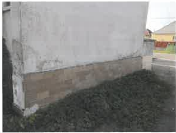
poškodený obklad sokla