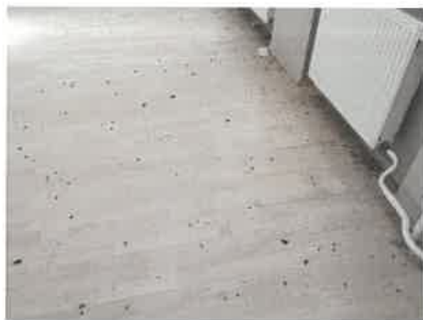
laminátová podlaha, ploché radiátory