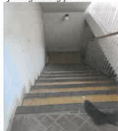
schody do suterénu