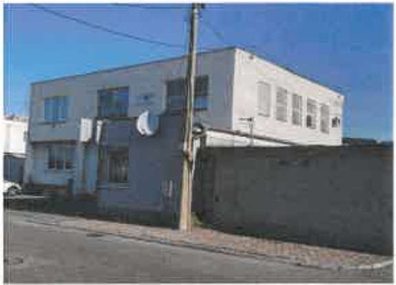
uličné pohľady na administratívnu budovu súp. č. 860/47 na pozemku parc. č. 2059/61 v Dunajskej Strede