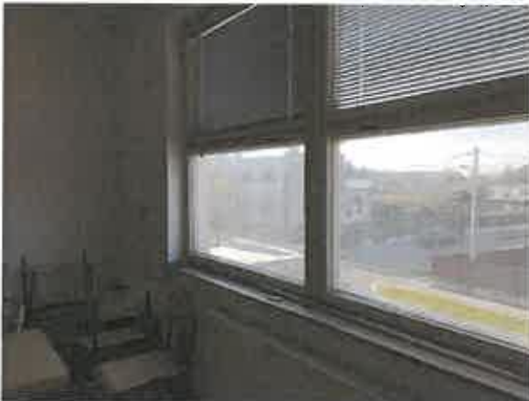
drevené zdvojené okná na II. NP