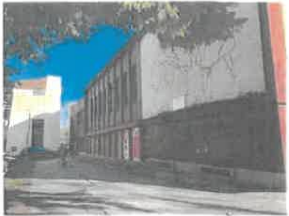
Vonkajšie pohľady na dom súp. č. 1191/16 na parcele č. 49 v Dunajskej Strede