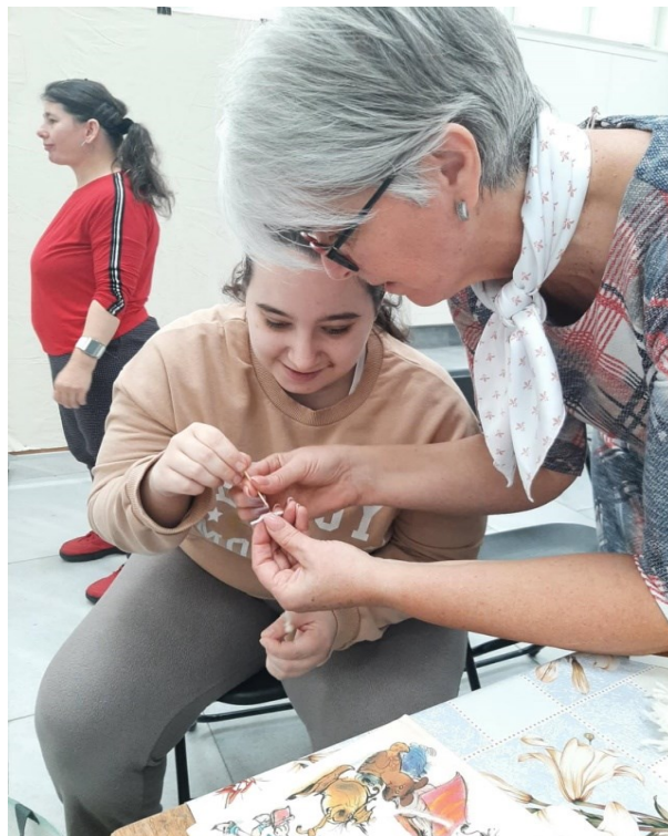
Obrázok : Aktivity prijímateľov denného stacionára

- Zmapovanie záujmu o vytvorenie podmienok pre rozšírenie prevádzkovej doby Denného stacionára sa uskutočnilo pomocou anonymného dotazníka. Výsledkom zisťovania bolo, že prijímatelia sociálnej služby sú spokojní s ponúknutou sociálnou službou, ba jednoznačne majú záujem o rozšírenie prevádzkovej doby stacionára.