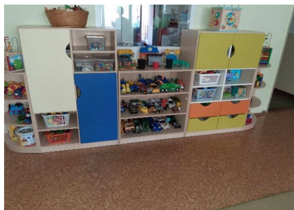
Obrázok : Záhradný nábytok, postielky, nábytok pre deti.