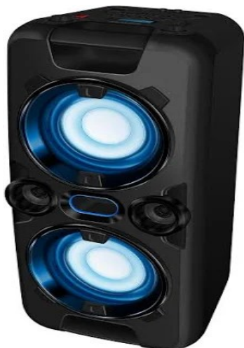
Obrázok : hojdačka, záhradný nábytok, reproduktor