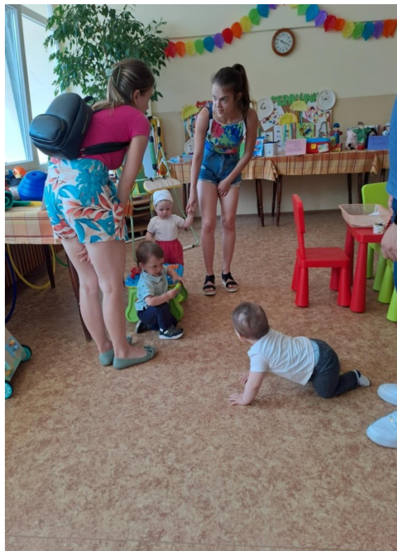
Obrázok: Deň otvorených dverí