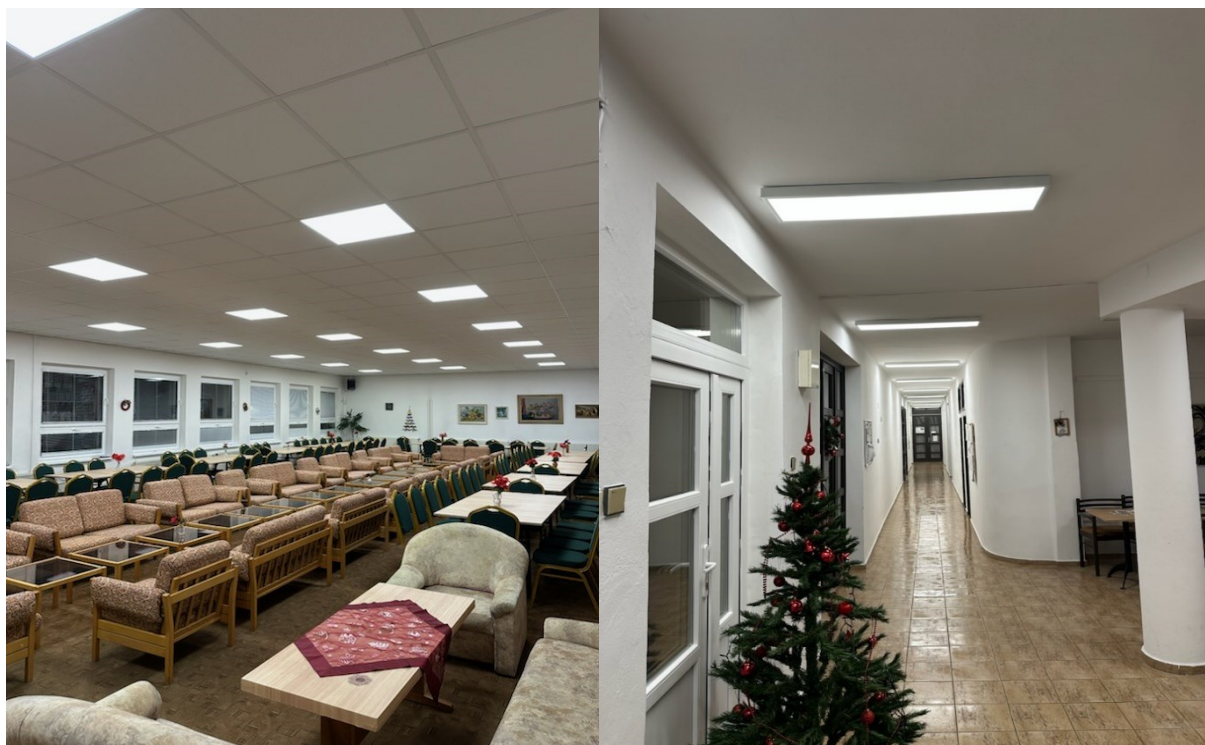
Obrázok: LED svietidlá v klube dôchodcov

- S pridelenými finančnými prostriedkami sme hospodárili zodpovedne. Na zvýšenie výdavkov v oblasti nárastu cien energií a dodávaných služieb sme reagovali včas. Naše zariadenie patrí do skupiny tzv. zraniteľných odberateľov, tým sa nám podarilo udržať zvýhodnené ceny za dodávku elektrickej energie. Vykurovací systém sme regulovali podľa aktuálneho počasia a teploty vonkajšieho vzduchu. V dennom centre (Klub dôchodcov) sme začali s výmenou svietidiel na úsporné LED osvetlenia, ktoré majú výhodu dlhšej životnosti a úspory v porovnaní s doterajšími svietidlami. Neuhradené dodávateľské faktúry neevidujeme.